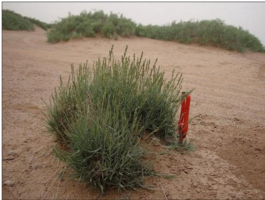
شکل ۲: تیپ گیاهی چمن شور Aeluropus littoralis در خاک‌های شنی حاشیه تالاب میقان.